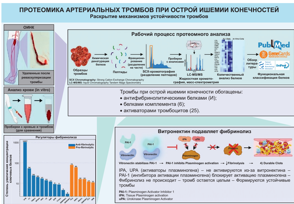
Рис. 3. Протеомный анализ артериальных тромбов при острой ишемии конечности (ОИНК). Адаптировано из статьи R.D. Stegman et al. Proteomics of arterial thrombi in acute limb ischemia. J. Thrombosis and Thrombolysis . 2025 [26]. Представлены основные группы белков, обогащенных в тромбах ОИНК, по сравнению с контрольными сгустками in vitro : антифибринолитические белки (витронектин), компоненты системы комплемента (C3, C5, фактор H), активаторы тромбоцитов и сквенджеры гема/гемоглобина. (Подписи и легенда переведены на русский язык авторами.)

пациентов с ОИНК после реваскуляризации, в то время как контрольные сгустки in vitro были получены из крови здоровых доноров путем индуцирования коагуляции тканевым фактором. Сгустки подвергались химическому и ферментативному расщеплению с последующей идентификацией и количественным определением белков с помощью жидкостной хроматографии с масс-спектрометрией (ЖХ-МС). В результате всестороннего обзора литературы наиболее распространенные белки были категоризированы в соответствии с их ролью в фибринолизе, деградации эритроцитов, активации комплемента и активации тромбоцитов. Тромбы ОИНК характеризуются высокой представленностью антифибринолитических белков